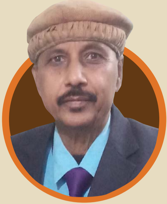
डॉ दिनेश नारायण वर्मा इतिहासकार