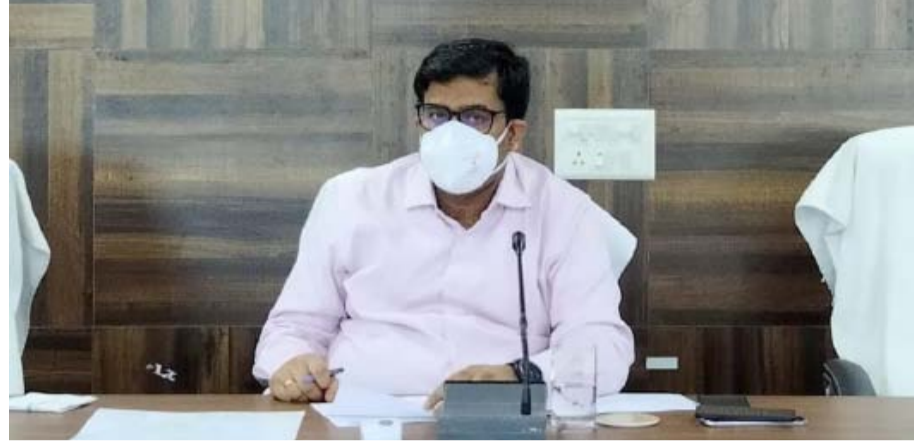
योजना अंतर्गत एससी/एसटी टोलों में पेयजल आपूर्ति की स्थिति, लिट्टीपाड़ा मल्टी विलेज पाइप वाटर सप्लाई स्कीम की स्थिति रीमेंनिंग वर्क ऑफ पाकुड़ अर्बन वाटर सप्लाई स्कीम की स्थिति बहू

शुक्रवार को समाहरणालय सभागार में उपायुक्त वरुण रंजन की अध्यक्षता में पेयजल आपूर्ति योजना एवं स्वच्छ भारत मिशन ग्रामीण की समीक्षात्मक बैठक का आयोजन किया गया। बैठक में उपायुक्त द्वारा पेयजल आपूर्ति से संबंधित चर्चा, पेयजल स्रोतों की स्थिति, प्रति पंचायत 5-5 अदद नलकूपों की स्थिति, नलकूपों के सड़े राईजर पाइप बदलने की स्थिति, आदिम जनजाति टोलों में पेयजल आपूर्ति योजना की स्थिति, मुख्यमंत्री जन-नल