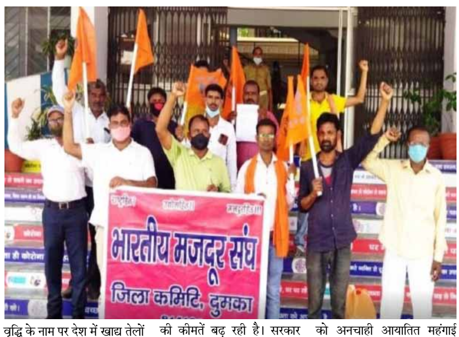
वृद्धि के नाम पर देश में खाद्य तेलों की कीमतें बढ़ रही है। सरकार को अनचाही आयतित महंगाई