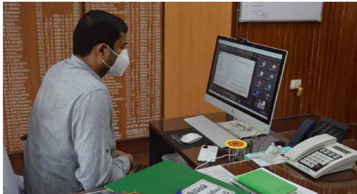
स्थानों को भी चिन्हित करें। उन्होंने कहा कि बीडीओ, सीओ तथा एमओआईसी यह सुनिश्चित करें कि जो सबसे अधिक महत्वपूर्ण है उन्हीं 6 हेल्थ सब सेंटर को चिन्हित किया जाय। इस दौरान यह विशेष ध्यान रखा जाय कि प्रस्ताव ऐसे भवन का दिया जाय जिस

दुमका। उपायुक्त ने वीडियो कॉन्फ्रेंसिंग के माध्यम से सभी प्रखंड विकास पदाधिकारी, अंचल अधिकारी एवं स्वास्थ्य विभाग के अधिकारियों के साथ बैठक की। बैठक में मुख्य रूप से 15वें वित्त आयोग द्वारा प्राप्त होने वाले राशि से संबंधित कार्ययोजना के संबंध में विस्तृत रूप से चर्चा की गयी। उन्होंने सभी प्रखंड विकास पदाधिकारी को निदेश दिया कि अपने प्रखंड अंतर्गत 6 हेल्थ सब सेंटर को चिन्हित करें जिसका भवन जर्जर अवस्था में हो। अगर जर्जर अवस्था में नहीं है तो रेंट वाले भवन में संचालित की जा रही है और उसके आसपास जमीन उपलब्ध है। कहां कि जैसे स्थान जहाँ आबादी अधिक हो और आसपास एक भी हेल्थ सब सेंटर उपलब्ध नहीं हो उन