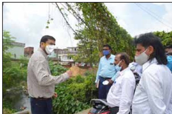
लिए भी उचित व्यवस्था करें। उन्होंने संबंधित अधिकारी से पूरे नगर क्षेत्र में साफ सफाई की स्थिति का जायजा लेते हुए कई निर्देश दिए। साथ ही सफाई कार्य के लिए लगे वाहन समय पर वाई

दुमका। उपायुक्त ने गुरुवार को दुमका शहर अंतर्गत बक्शीबांध में डंपिंग यार्ड का निरीक्षण किया। निरीक्षण के दौरान व्यवस्थाएं सुचारू रूप से चलाने हेतु संबंधित को कई महत्वपूर्ण निर्देश दिया गया। उपायुक्त ने डंपिंग यार्ड क्षेत्र का भ्रमण कर निरीक्षण किया। इस क्रम में उन्होंने नगर परिषद अधिकारी को निर्देश दिया कि इस यार्ड के कूड़े को शहर से निकलने एवं व्यक्तिकल्पक स्थान का चयन करने हेतु कार्ययोजना बनाए। तब तक लोगों को परेशानी न हो इसके