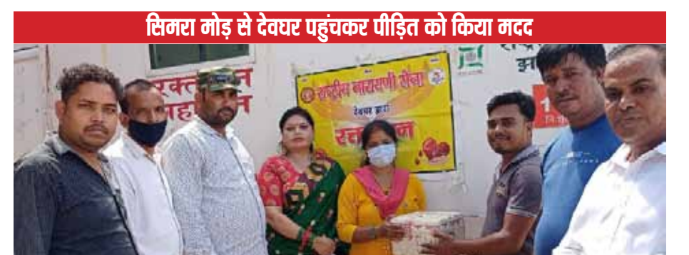
सिमरा मोड़ से देवघर पहुंचकर पीड़ित को किया मदद