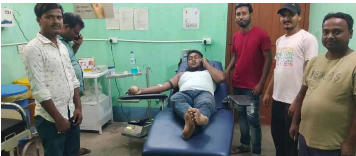
उसे शब्दों में बर्णना मुमकिन नहीं है। इसी कड़ी में जिले में कई संगठन

पाकुड़। रक्तदान महादान होता है। धीरे-धीरे लोग इसका महत्व समझने लगे हैं और रक्तदान के प्रति जागरूकता का माहौल भी देखने को मिल रहा है। फिर भी बहुत सारे जिनको अभी भी रक्तदान करने से डर लगता है, तो हमारा कर्तव्य है कि हम उन्हें जागरूक करे। हमको यह भावना जन-जन तक पहुंचानी चाहिए कि रक्तदान महादान है। इससे लाखों लोगों की जिंदगी बच सकती है। रक्तदान हमारे शरीर के लिए बहुत ही जरूरी होता है, और इससे एक व्यक्ति को जान भी बच सकती है, रक्तदान स्त्री या पुरुष कोई भी कर सकता है। अगर आप की वजह से किसी की जिन्दगी बचती है तो आपको जो संतुष्टि का एहसास होगा