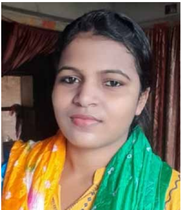
दखरेख में प्रतियोगिता परीक्षाओं की तैयारी में सक्रिय हूँ। ज्ञातव्य है कि