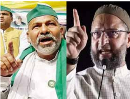
कि उन्हें हैदराबाद में ही बांधकर रखें।

भारतीय किसान यूनियन (बीकेयू) के नेता राकेश टिकैत ने ऑल इंडिया मजलिस ए इत्तेहादुल मुस्लिमीन (एआईएमआईएम) के नेता असदुद्दीन ओवैसी को बेलगाम सांड बताया है। हैदराबाद में किसानों के एक सम्मेलन में टिकैत ने कहा कि बिना नाम लिए कहा कि वह देशभर में बीजेपी की मदद करते हैं। किसान नेता ने लोगों से कहा