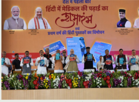
मुख्यमंत्री एम के स्टालिन ने कहा कि अमित शाह के नेतृत्व वाली राजभाषा संसदीय समिति ने जो रिपोर्ट सौंपी है वह, दरअसल हिंदी थोपने का प्रयास है। ये घटनाएं साल 1964 की याद दिलाती हैं, जब हिंदी विरोध की आग ने पूरे तमिलनाडु को गिरफ्त में ले लिया था।

हिंदी पर ही विवाद क्यों इसके बावजूद राजनीतिक कारणों से हिंदी का विवाद बार-बार खड़ा किया जाता है। आश्रय है कि हिंदी का विरोध करने वाले विदेशी भाषा अंग्रेजी को अंगीकार करते हैं किंतु अपने देश की भाषा