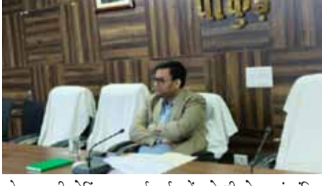
उपायुक्त वरुण रंजन ने मंगलवार को समाहरणालय सभागार में भूमि संरक्षण विभाग, कृषि विभाग और उद्यान विभाग में संचालित योजनाओं की समीक्षा की।

पाकुड़ । उपायुक्त वरुण रंजन ने मंगलवार को समाहरणालय सभागार में भूमि संरक्षण विभाग, कृषि विभाग और उद्यान विभाग में संचालित योजनाओं की समीक्षा की। उपायुक्त वरुण रंजन ने झारखंड कृषि ऋण माफी योजना, पीएम किसान का ई-केवाईसी, पीएम किसान के लाभुकों को केसीसी से आच्छादित की स्थिति, वर्ष 2022-23 की उपलब्धि की अद्यतन स्थिति, 90 प्रतिशत एवं शत प्रतिशत अनुदान पर बीज वितरण की स्थिति, लैम्प पर बीज वितरण की उपलब्धि के बारे में जानकारी ली। इस दौरान जिला कृषि पदाधिकारी द्वारा बताया गया कि कृषि ऋण माफी योजना में ई-केवाईसी के लिए 3900 आवेदन लंबित है एवं मुख्यमंत्री सुश्रार राहत योजना में अब तक कुल 63,822 आवेदन जनरेट किया गया है। इस संबंध में उपायुक्त ने सभी आवेदनों को अंचल से सत्यापित करने का निर्देश दिया। वहीं भूमि संरक्षण अधिकारी द्वारा बताया गया कि 60 तालाब जोषोद्धार करने का लक्ष्य प्राप्त था, अब तक 51 तालाब जोषोद्धार का कार्य पूर्ण हो चुका है। उपायुक्त ने शेष तालाबों का कार्य समय पूर्ण करने का निर्देश दिया। डी बोरिंग के लिए लाभुकों समिति के साथ बैठक कर जल्द