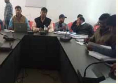
स्वच्छ भारत मिशन ग्रामीण एवं जल जीवन मिशन के तहत पेयजल एवं स्वच्छता प्रमंडल पाकुड़ के द्वारा एक दिवसीय कार्यशाला का आयोजन महेशपुर प्रखंड में आयोजित किया गया।