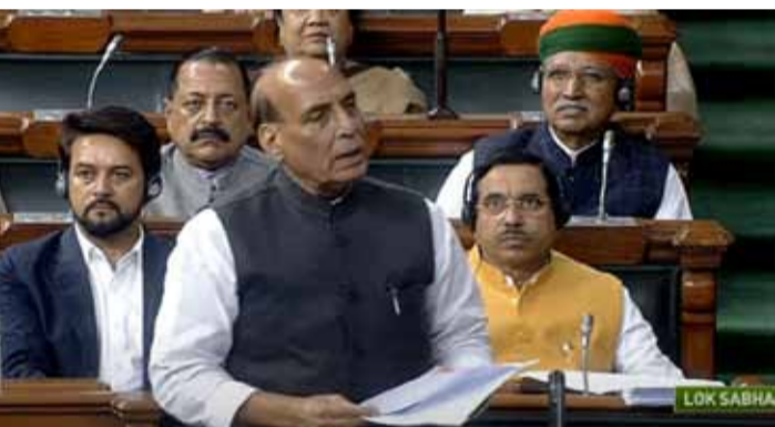
को पीएलए ट्रूप ने तवांग में एलएसी का उल्लंघन कर नियम तोड़े थे। भारतीय सेना ने पीएलए को अतिक्रमण से रोका। उन्हें उनकी पोस्ट पर जाने के लिए मजबूर कर दिया। इस घटना में दोनों ओर के कुछ सैनिकों को चोटें भी आई हैं। हमारे किसी भी सैनिक की न तो मृत्यु हुई है और न कोई गंभीर रूप से घायल हुआ है।

समय से हमने हस्तक्षेप किया। इसकी वजह से चीनी सैनिक वापस चले गए। इसके बाद लोकल कमांडर ने 11 दिसंबर को चाइनीज काउंटर पार्ट के साथ व्यवस्था के तहत प्रैगमैटिक मीटिंग की। चीन को ऐसे एक्शन के लिए मना किया गया और शांति बनाए रखने को कहा। कूटनीतिक स्तर पर भी मुद्दा उठाया गया। हमारी सेनाएं भौमिक अखंडता को सुरक्षित रखने के लिए प्रतिबद्ध हैं। किसी भी प्रयास को रोकने के लिए तैयार हैं। विश्वास है सदन सेनाओं की वीरता और साहस को समर्थन देगा। यह संसद बिना किसी संशय के भारतीय सेना के शौर्य, पराक्रम और क्षमता का अभिनंदन करेगी। इससे पहले तवांग झड़प को लेकर संसद में भारी हंगामा हुआ। इस पर गृहमंत्री अमित शाह ने संसद के बाहर कहा कि भारत की एक इंच जमीन पर चीन ने कब्जा नहीं किया।