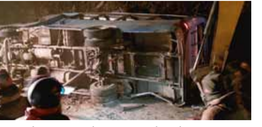
दी गई जानकारी के मुताबिक, ये हादसा करीब 6.30 बजे (स्थानीय समयानुसार) हुआ। दुर्घटना का शिकार हुई बस एक धार्मिक समारोह से आए लोगों को ले जा रही थी। जिले के पुलिस अधीक्षक

काठमांडू/एजेसी। भारत के पड़ोसी देश नेपाल में दर्दनाक सड़क हादसे का मामला सामने आया है। मध्य नेपाल के कावरेपालनचोक जिले में मंगलवार शाम हुई एक सड़क दुर्घटना में 17 लोगों की मौत हो गई। कावरेपालनचोक के एसपी ने इसकी जानकारी दी है। उन्होंने बताया कि हादसे में 15 से ज्यादा लोग घायल भी हो गए हैं। जिन्हें इलाज के लिए अस्पताल में भर्ती कराया गया है। कावरेपालनचोक के एसपी द्वारा